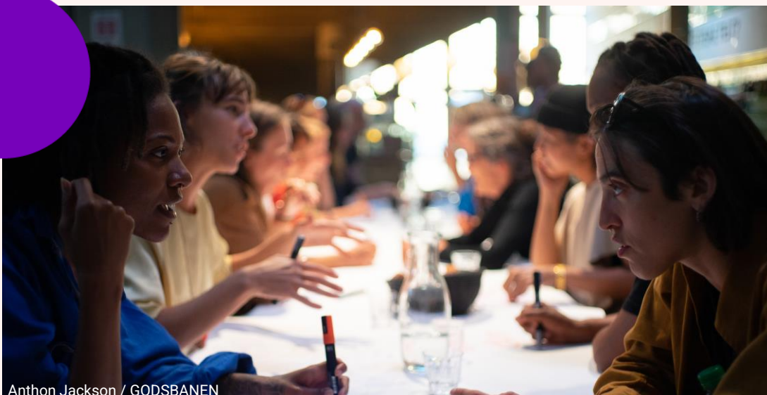
Anthon Jackson / GODSBANEN

Det gør vi gennem dialog og samarbejde med både lokale, regionale og nationale politikere, deltagelse i Dansk Kulturliv og løbende projektudvikling og fundraising.